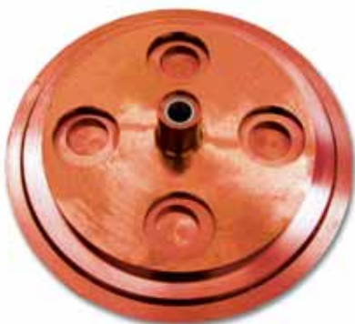
Juegos de platos para todos los dosificadores del mercado