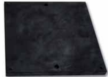
Tampones, desmoldeos, pre-prensados, campanas