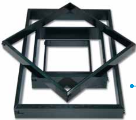
Marquitos para todos los formatos y espesores de baldosa

COREMA también fabrica una amplia gama de repuestos para maquinaria de origen italiano, tal como se muestra en este catálogo: