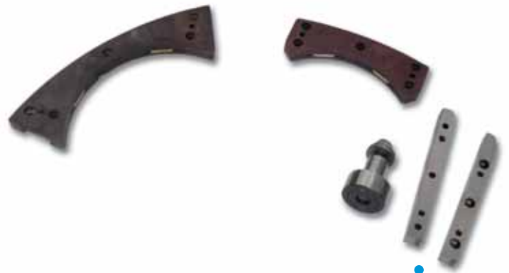
Medias lunas, listeles, bulones, carrillas