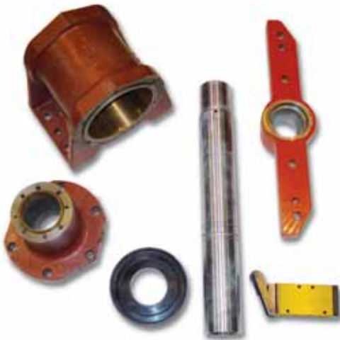
Conjuntos de botella para prensa (venta del conjunto montado o en despiece)