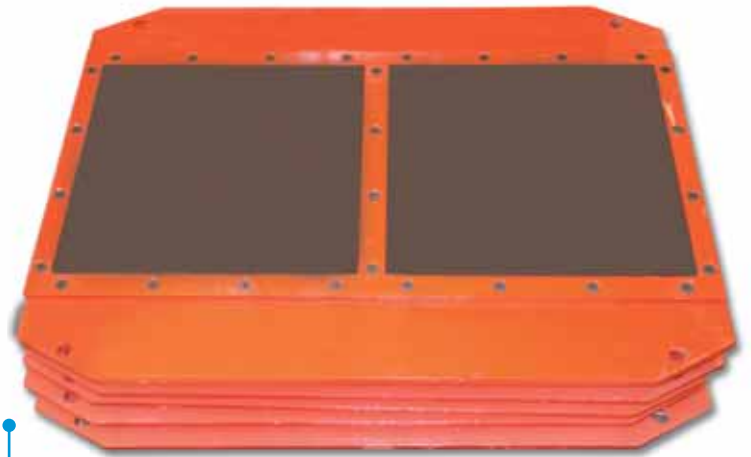
Juegos de platos completos (plato, chapa portafondo, placa vibrante)