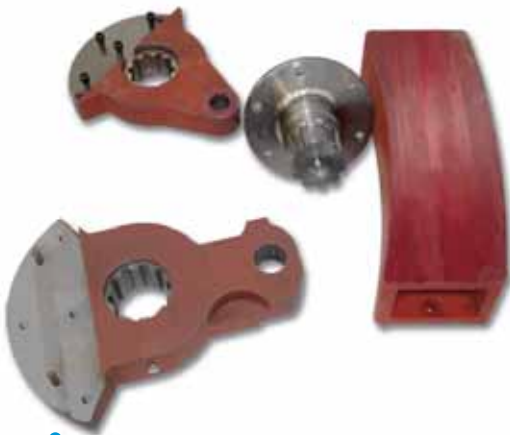
Bielas, ejes del reductor, yunques, castilletes